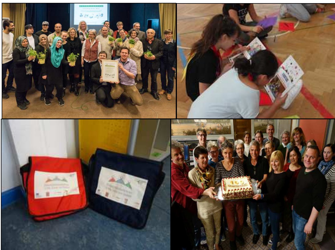
Grünes Modellquartier Schöneberger Norden – Mädchenfußball – Bildungsbotschafter/innen - 100. Sitzung des Quartiersrates

Team Quartiersmanagement Schöneberger Norden