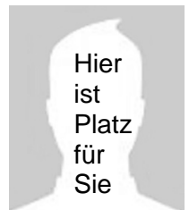
Väter und ältere Brüder → aus dem Schöneberger Norden